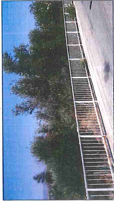
Ακίνητο 1 [Αρ. Τεμαχίου 211]